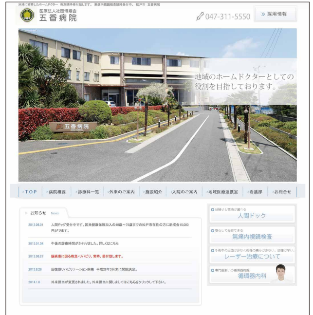
五香病院様ホームページ